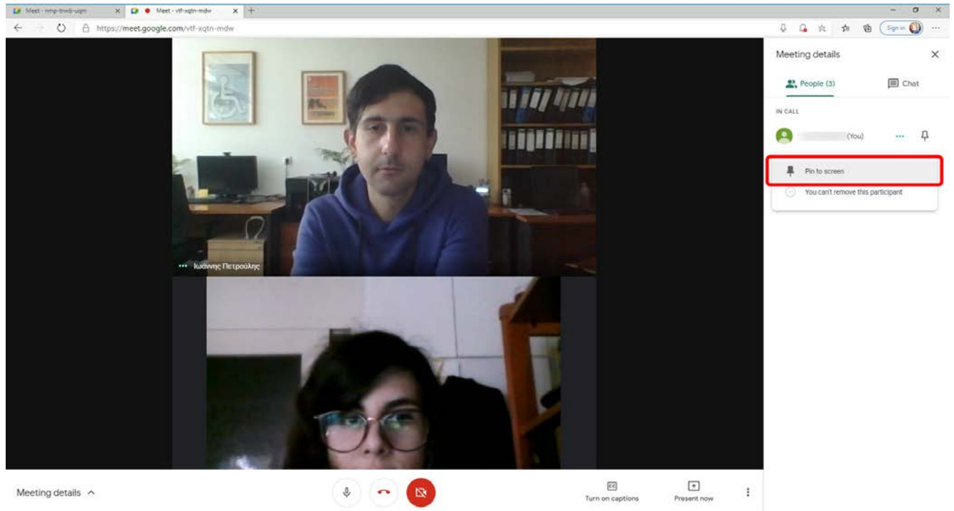
Εικόνα 5. Επιλογή πεδίου Pin to screen_Όνομα ΦμεΑ