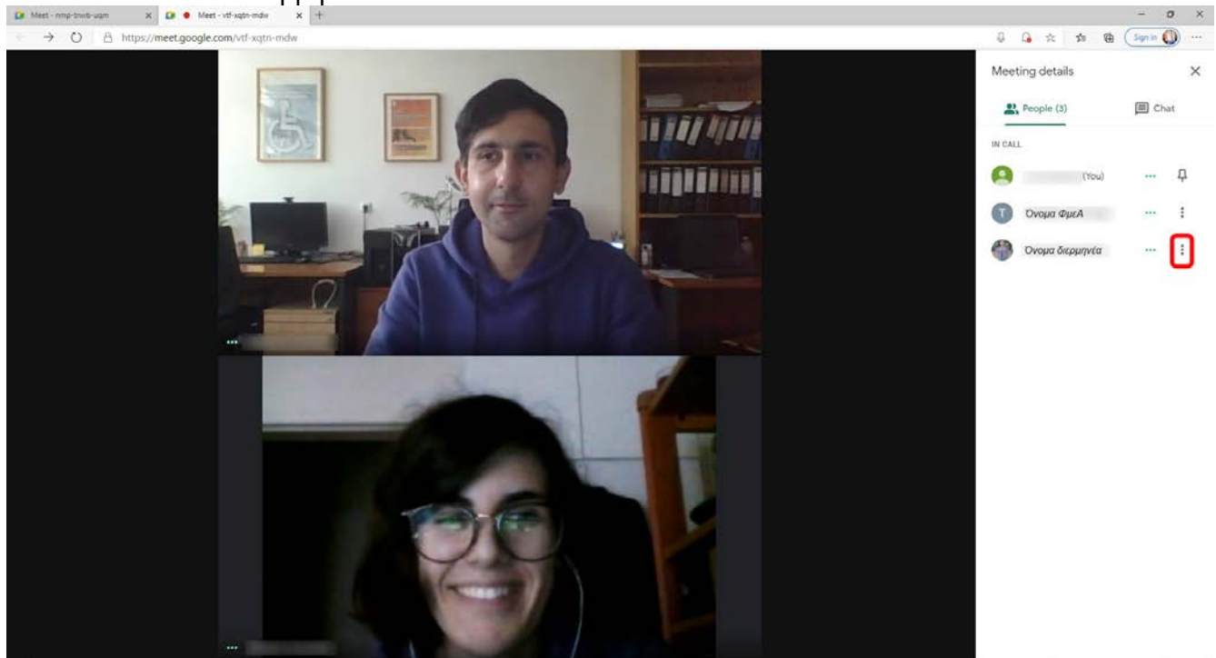
Εικόνα 2. Επιλογή εικονιδίου με τρεις κάθετες τελίτσες_Όνομα διερμηνέα