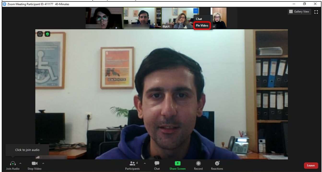
Εικόνα 6. Επιλογή πεδίου "Pin" / "Pin video" _ΦμεΑ