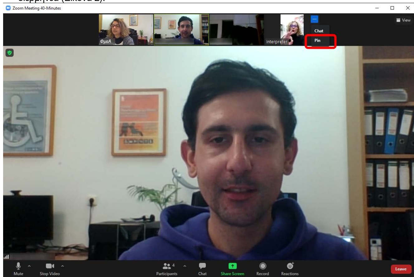
Εικόνα 2. Επιλογή πεδίου "Pin_Interpreter"