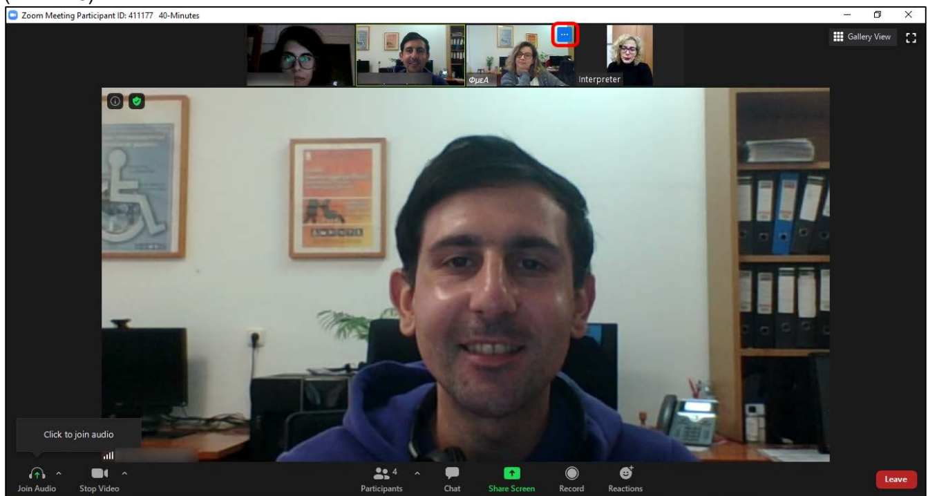
Εικόνα 5. Επιλογή εικονιδίου με τρεις τελίτσες_ΦμεΑ