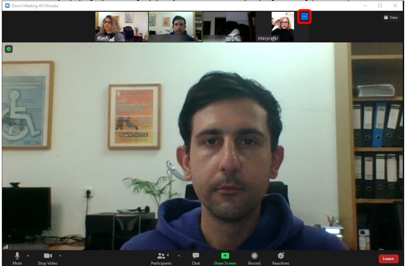
Εικόνα 1. Επιλογή εικονιδίου με τρεις τελίτσες_Interpreter